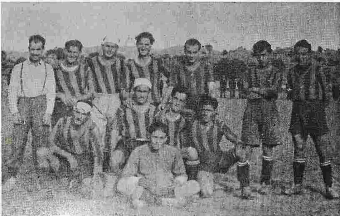
Equipo de Fútbol de Azara de mucho tiempo atrás.